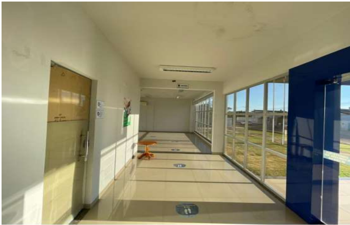
Pintura da parede interna.