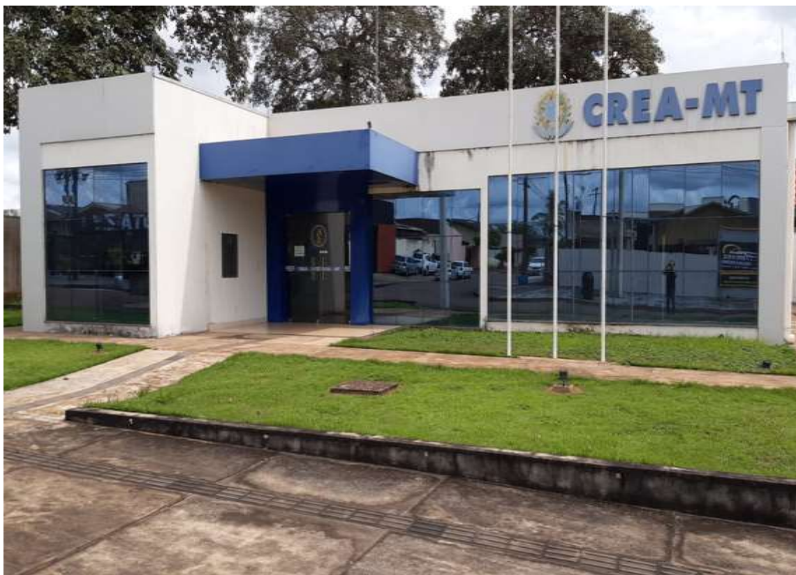
Pintura do ACM, logo do CREA, brasão.