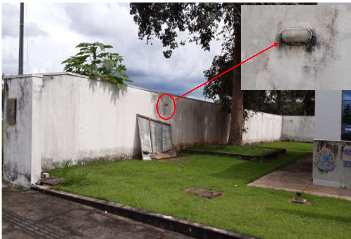
Pintura do muro externo e troca das lapadas queimadas.