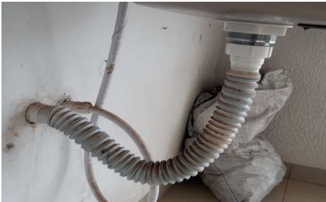
Substituição do sifão.