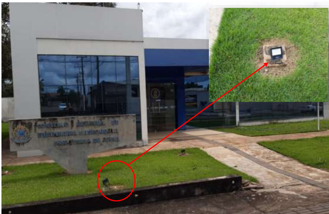
Pintura do totem de identificação do CREA-MT e troca dos refletores.