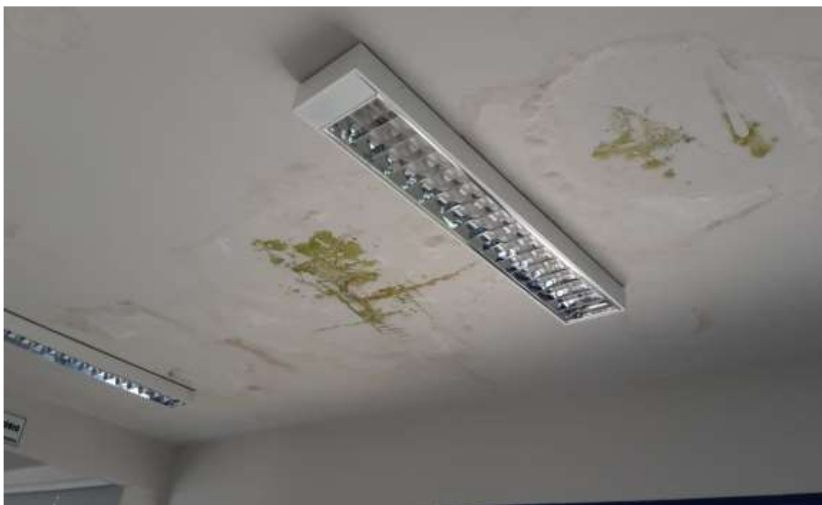
Pintura da parede externa.