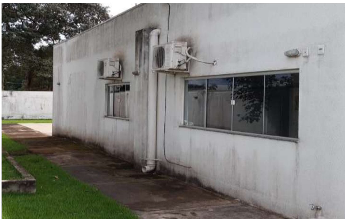
Impermeabilização e pintura da parede externa.