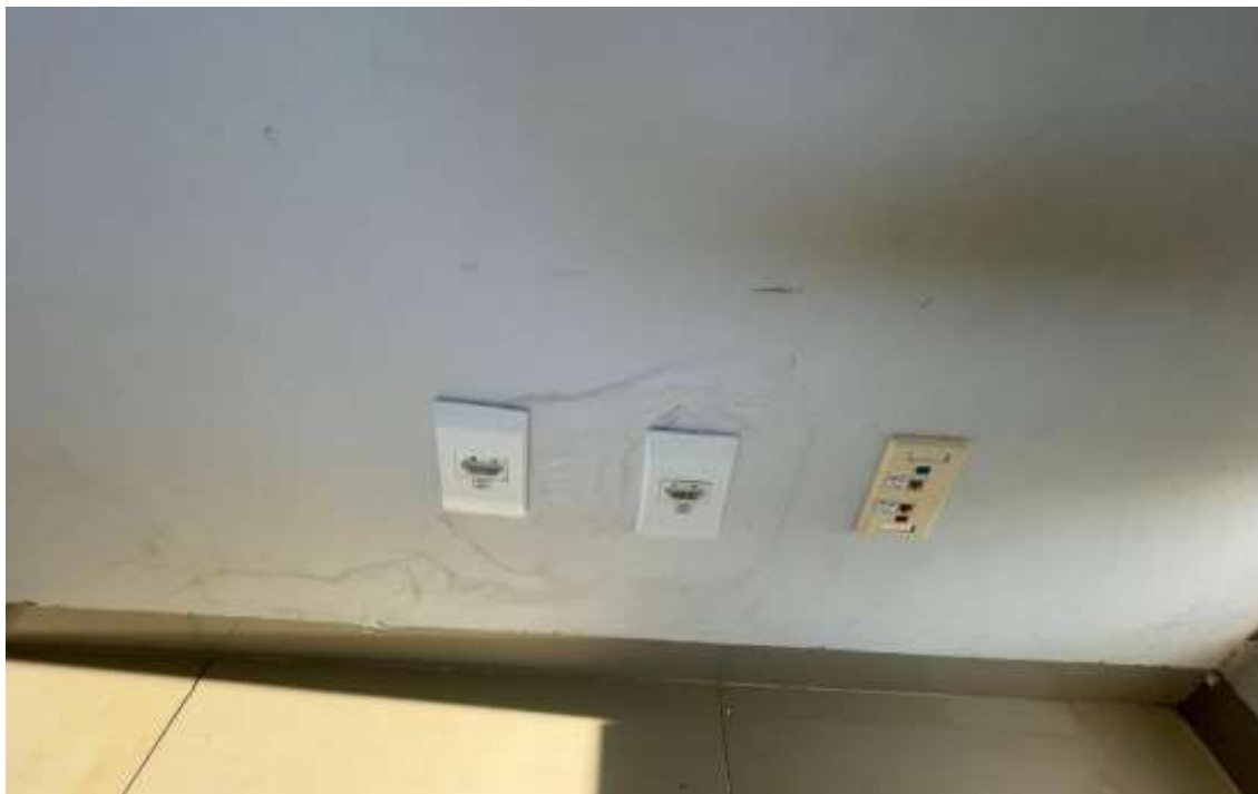
Pintura da parede.