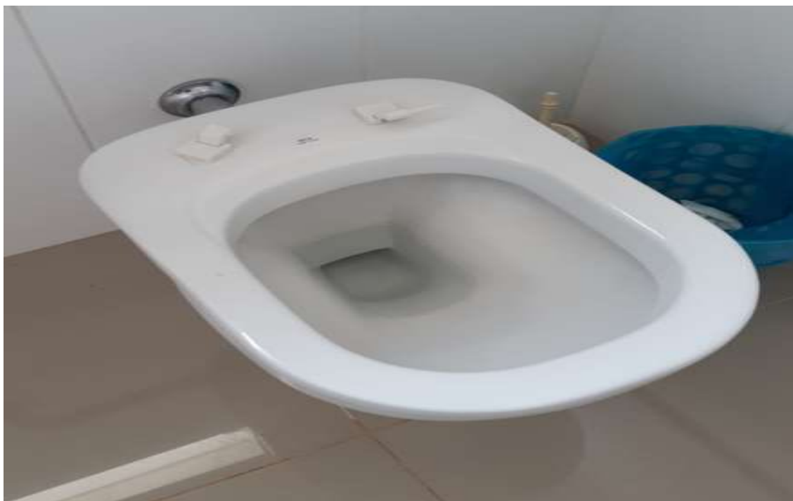
Substrução da tampa do vaso sanitário.