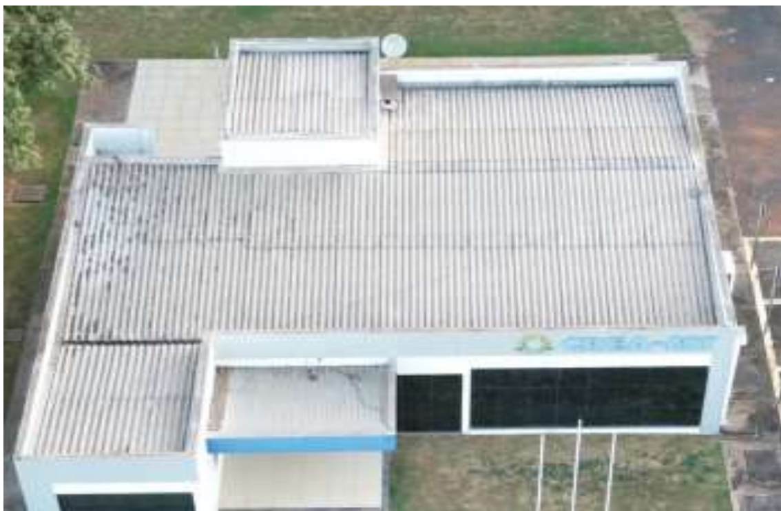
Substituição ou reparo dos telhados danificados, calhas e rufos.