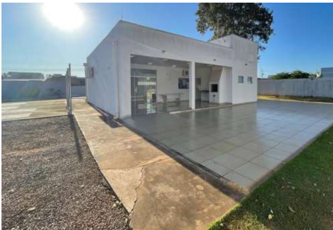
Demolição da calçada e execução de calçada.