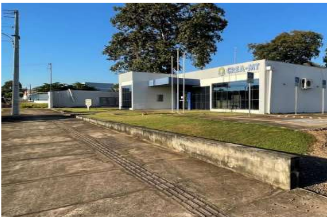
Pintura da calçada, do piso tátil e vaga de PCD.