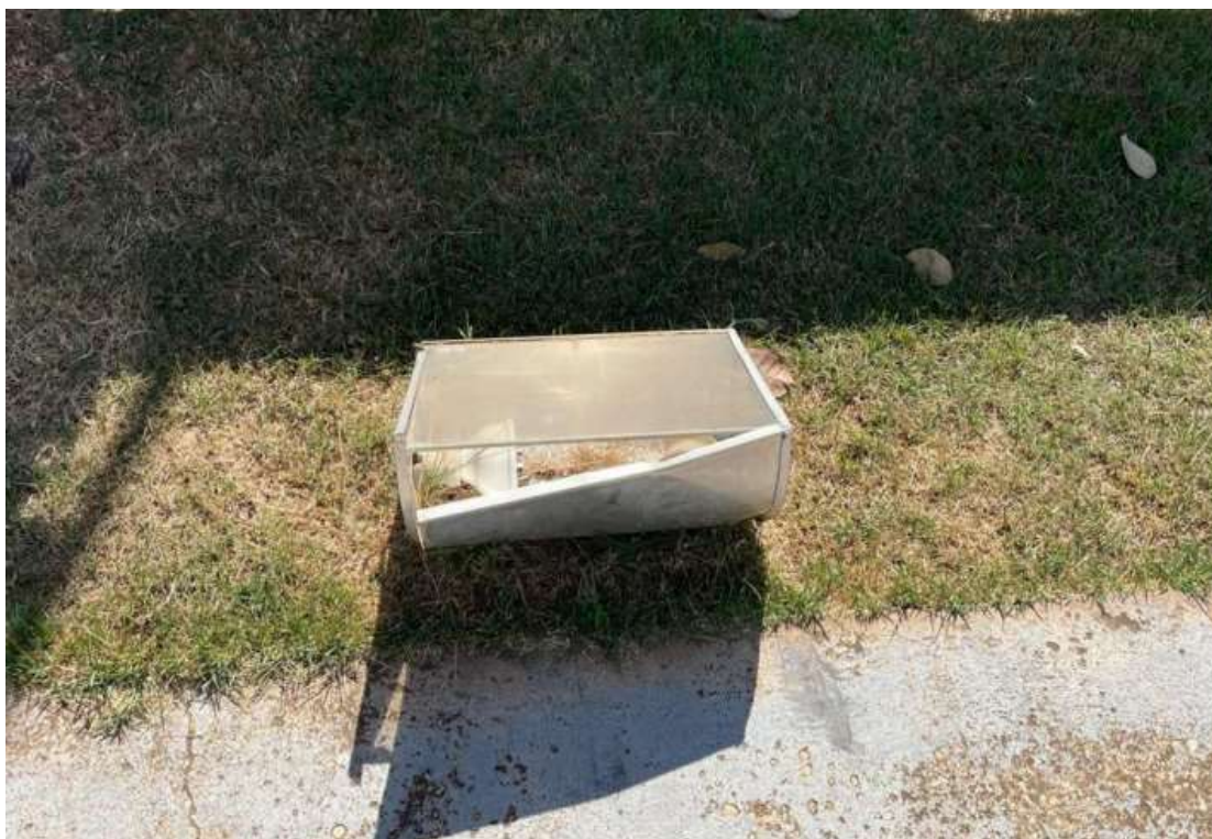
Substituição dos refletores danificados.