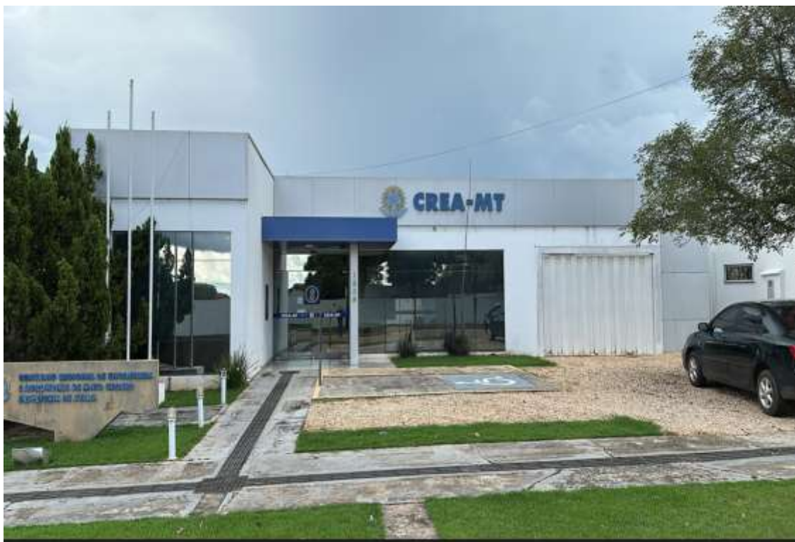
Pintura da parede externa, pintura do ACM da fachada, letras caixa CREA- MT e piso tátil.