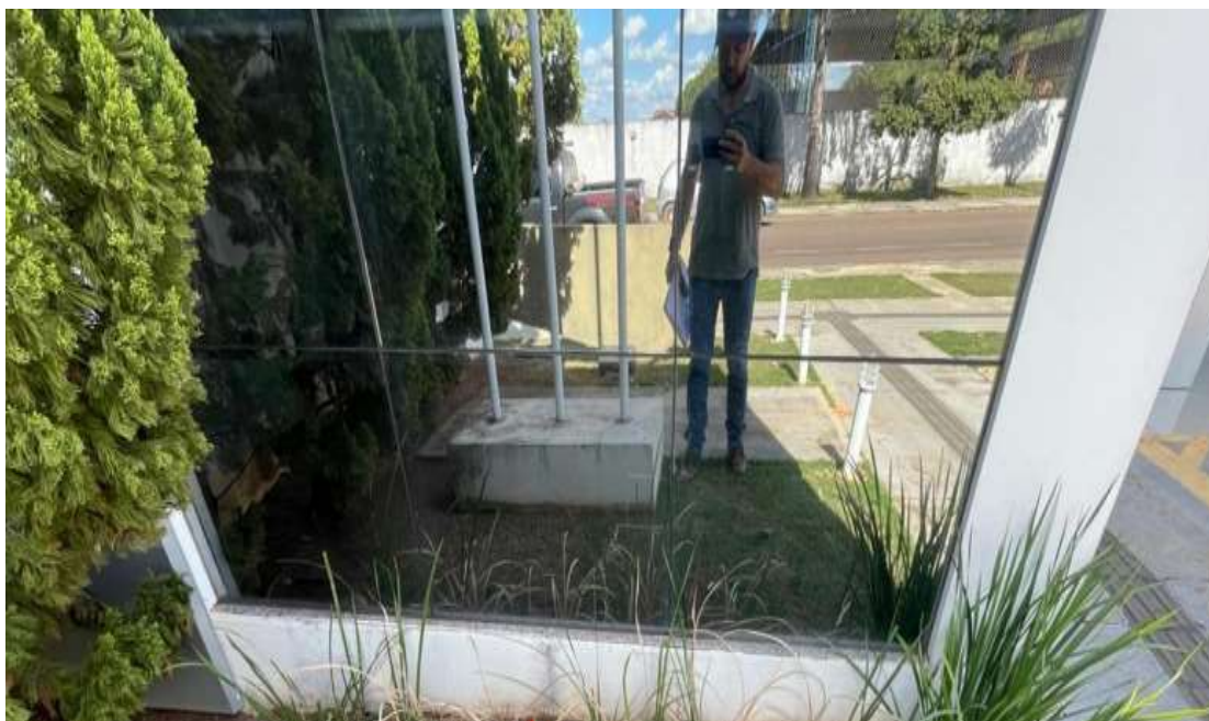
Execução de calçada de proteção.