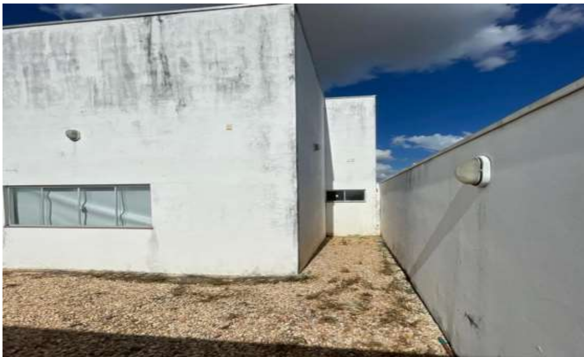
Pintura do muro e parede externo, troca de lâmpadas queimadas.