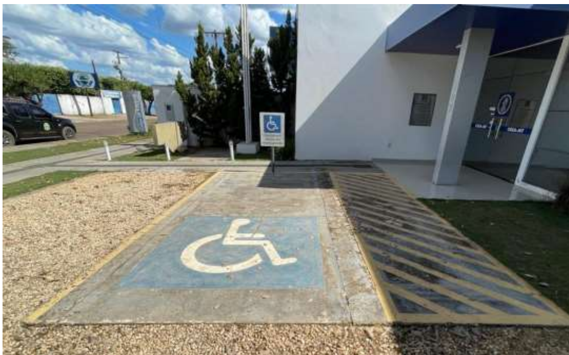
Pintura da calçada e vaga de PCD.