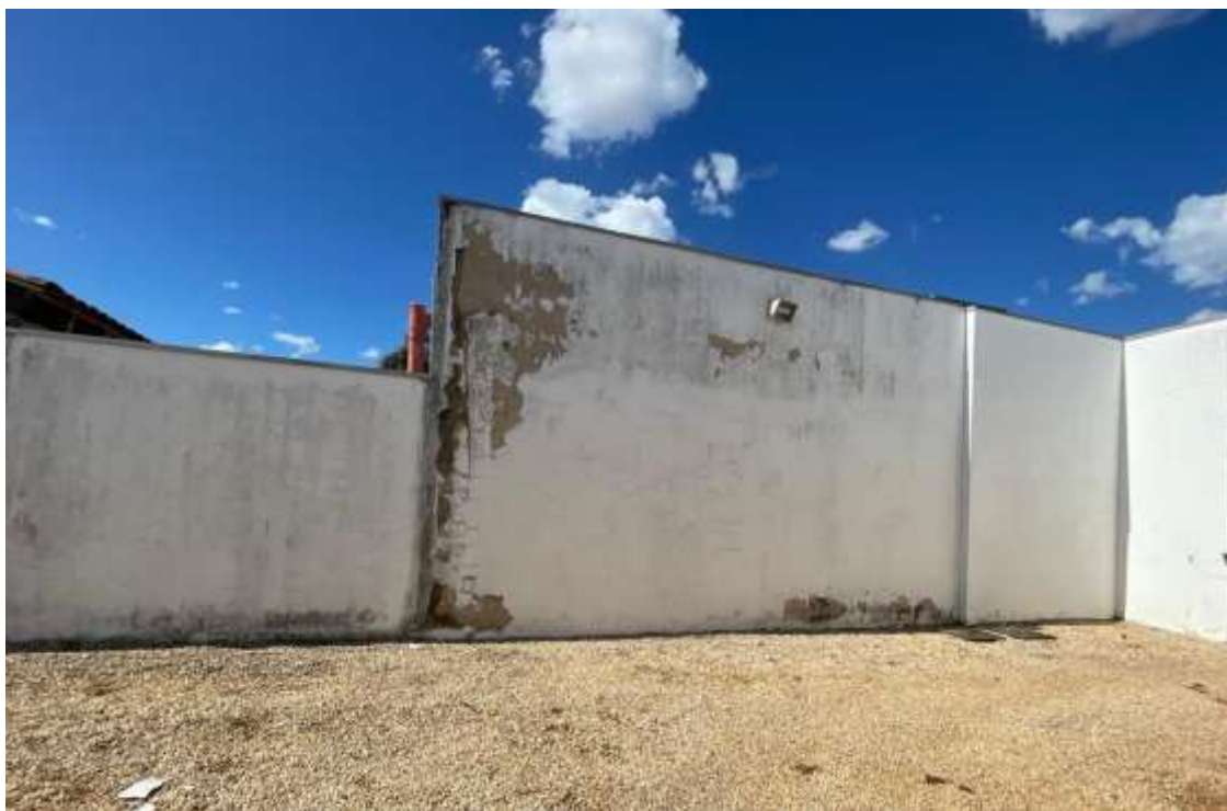
Pintura do muro externo.