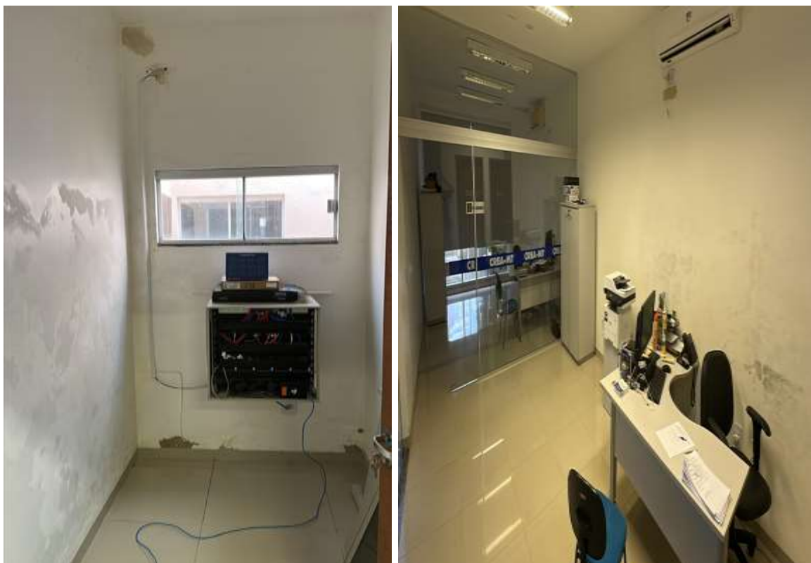
Recuperação e pintura da parede e do forro.