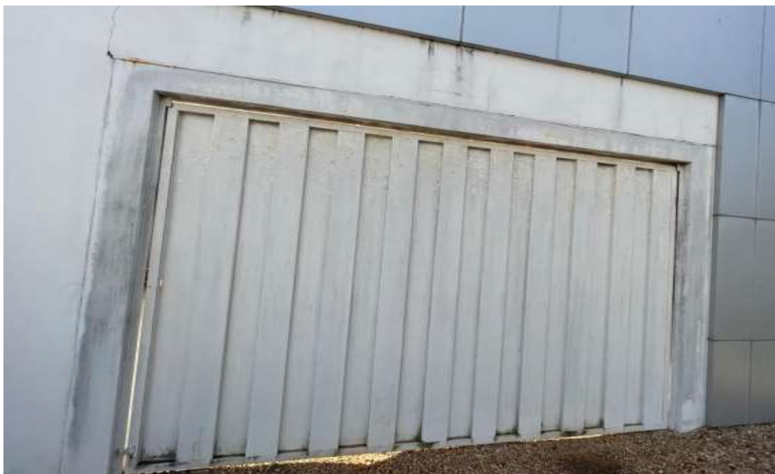
Pintura do portão.