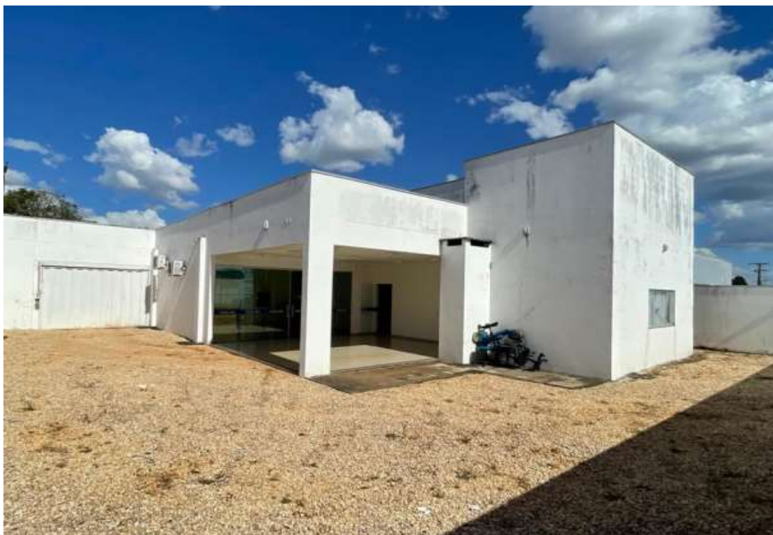
Execução de calçada de proteção.